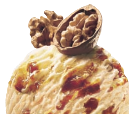
MAPLE WALNUT VLAŠKÝ OŘECH