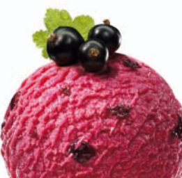
BLACKCURRANT ČERNÝ RYBÍZ