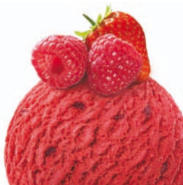
RASPBERRY & STRAWBERRY MALINA & JAHODA

CENA ZA KOPEČEK 25,- PRICE PER SCOOP 25,-