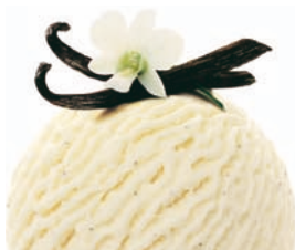
VANILLA DREAM VANILKA