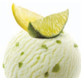
LEMON & LIME CITRÓN & LIMETKA