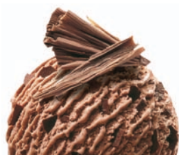
SWISS CHOCOLATE ČOKOLÁDA